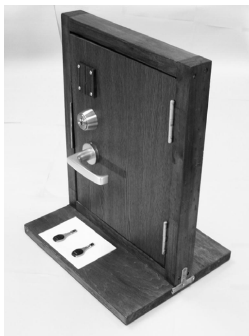
図2 赤外線 ID を用いた錠前装置